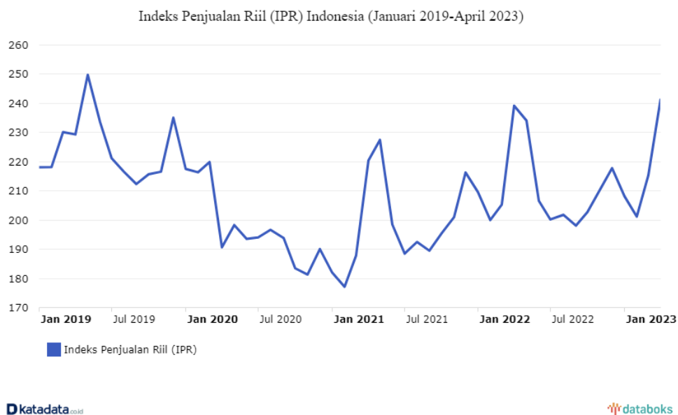
Gambar 1. Indeks Penjualan Ritel

Saat angka Indeks Penjualan Riil (IPR) naik, penjualan riil pedagang retail diasumsikan meningkat, yang mengindikasikan pula adanya kenaikan konsumsi masyarakat. Sebaliknya, jika angka IPR turun, maka penjualan retail dan konsumsi masyarakat dianggap berkurang (Ahdia, 2023)