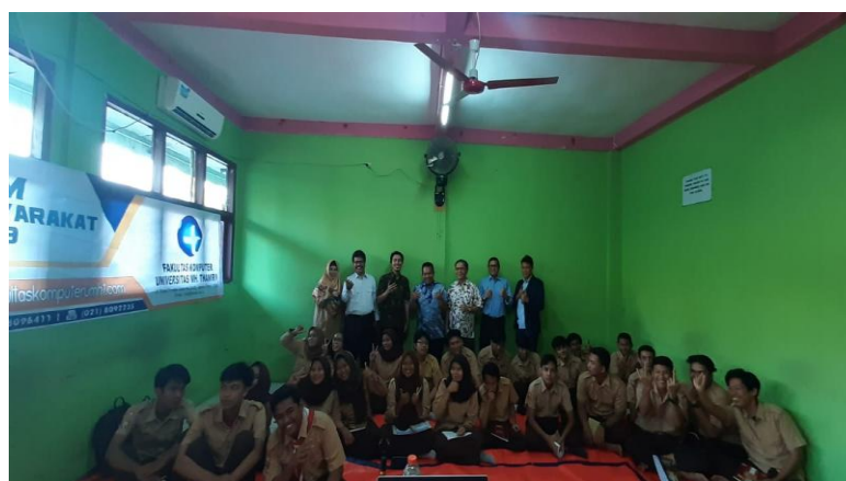
Gambar 3. Pelaksanaan Pelatihan

Selanjutnya tim pelaksana mengadakan inventarisasi awal permasalahan yang dihadapi oleh mitra terkait dengan penerapan teknologi informasi dalam peningkatan prestasi belajar siswa. Hasil inventarisasi kemudian didapatkan permasalahan awal bahwa kemampuan siswa dalam menyerap materi masih rendah, kemandirian belajar juga rendah yang berujung kepada capaian siswa dalam nilai Ujian Nasional (UN) menjadi rendah.