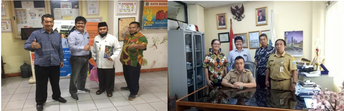
Gambar 3. Tahap Pejajakan/Permohonan

Pelaksanaan kegiatan diawali dengan kegiatan penjajakan yang dilakukan sebanyak 3 kali untuk mematangkan persiapan Sosialisasi Literasi Online.