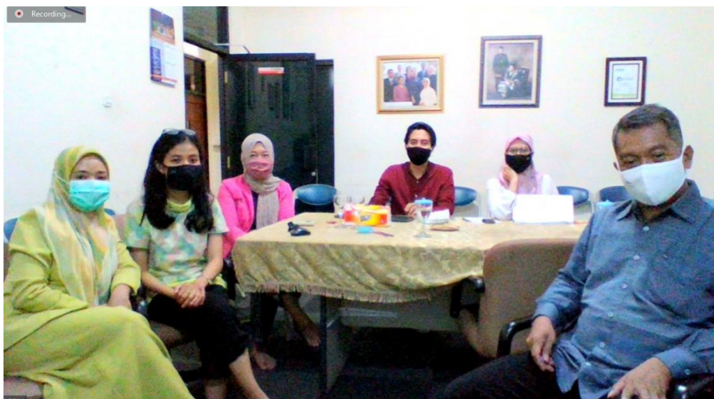
Gambar 2. Foto Dokumentasi