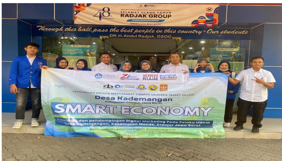
Gambar 3. Tahap Pelaksanaan Pelatihan