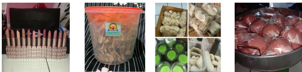
Gambar 2. Beberapa Contoh Foto Produk Peserta

Seminggu sebelum kegiatan pelatihan online dilakukan penjangkaran peserta dengan memberikan pengumuman melalui pesan Whatsapp kepada ibu Lurah dan bapak RW Kp. Pulo Geulis tentang kegiatan ini agar dapat disebarkan kepada Kelompok UMK di sana. Para warga UMK Pulo Geulis dapat mendaftarkan diri dengan menghubungi pihak panitia. Untuk mempermudah penyaluran informasi dan komunikasi panitia dan peserta maka dibuatkan group Whatsapp untuk para peserta untuk. Adapun pemberian materi oleh narasumber diberikan dua hari sebelumnya melalui Whatsapp group untuk dipelajari peserta dan dapat dipraktikkan dirumah. Dari materi tersebut dibuatkan perlombaan foto produk terbaik yang nantinya pada saat acara akan dinilai dan didiskusikan bersama.