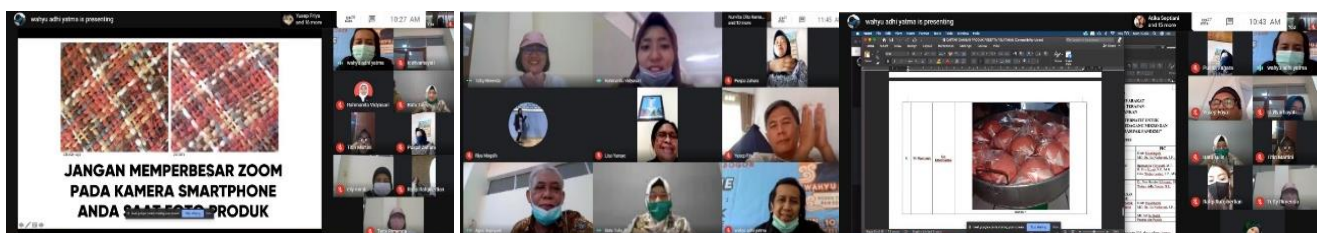
Gambar 5. Pelatihan Online Trik Memotret Produk