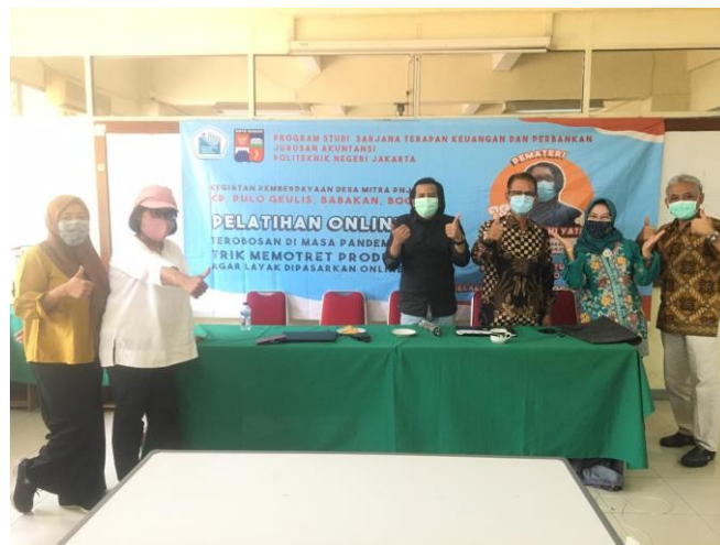
Gambar 7. Panitia dan Narasumber melaksanakan kegiatan dari kampus

Video Animasi Tips Menjual Produk Makanan Secara Online saat Pandemi Covid-19