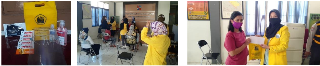
Gambar 8. Penyerahan Bantuan Paket Pencegahan Covid-19

Setelah selesai kegiatan terdapat beberapa evaluasi untuk kegiatan ini salah satunya adalah waktu pelatihan online yang dilaksanakan pada waktu pagi hari bertepatan dengan jadwal sekolah online anak sekolahan, sehingga banyak peserta UMK Kp. Pulo Geulis yang tidak bisa mengikuti pelatihan ini secara langsung karena ponsel digunakan untuk sekolah online. Kegiatan ini juga diumumkan hanya untuk warga Kp. Pulo Geulis seharusnya dapat terbuka untuk peserta umum juga. Selanjutnya terdapat masukan dari peserta bahwa durasi pelatihan cukup lama yaitu selama hampir 3 jam karena peserta terbatas akan kuota.