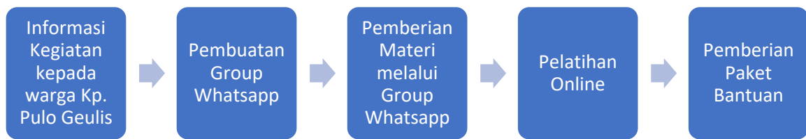
Gambar 1. Alur Pelaksanaan Kegiatan