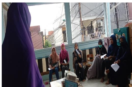
Gambar 2. Kegiatan Penyuluhan dan Diskusi dengan Guru dan Orang Tua