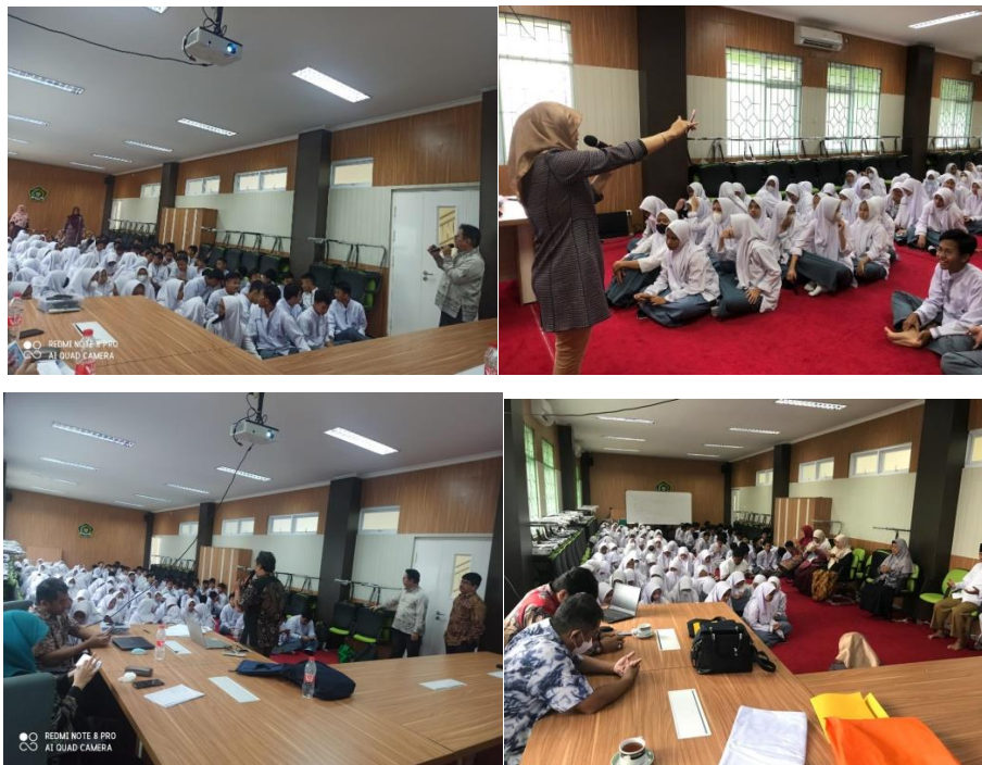
Gambar 4. Tahap Pelaksanaan Pelatihan