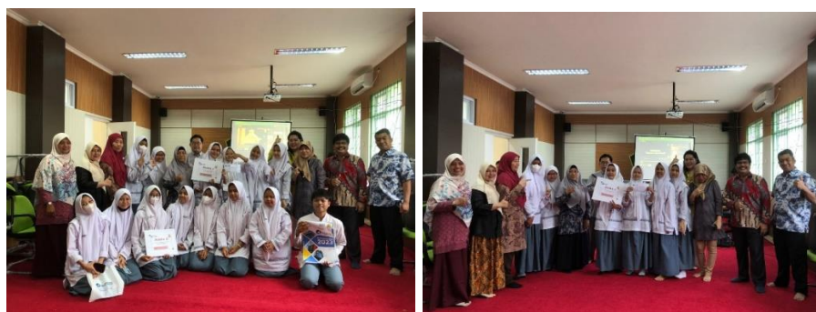
Gambar 5. Pemberian Hadiah