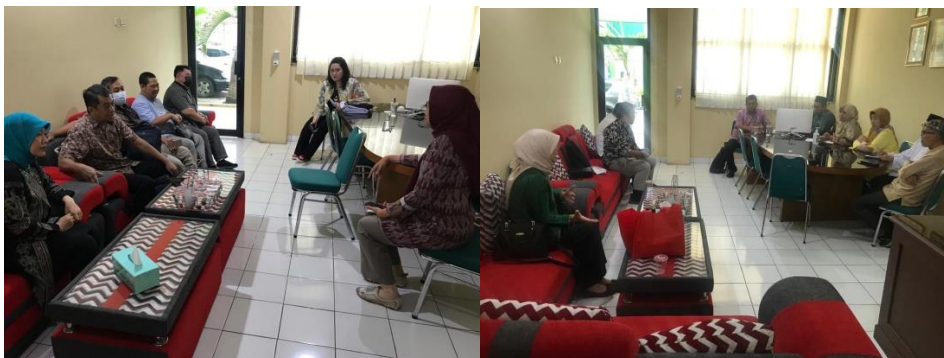
Gambar 3. Tahap Pejajakan/Permohonan

Pelaksanaan kegiatan diawali dengan kegiatan penjajakan yang dilakukan sebanyak 2 kali untuk mematangkan persiapan pelatihan Literasi Pasar Modal.