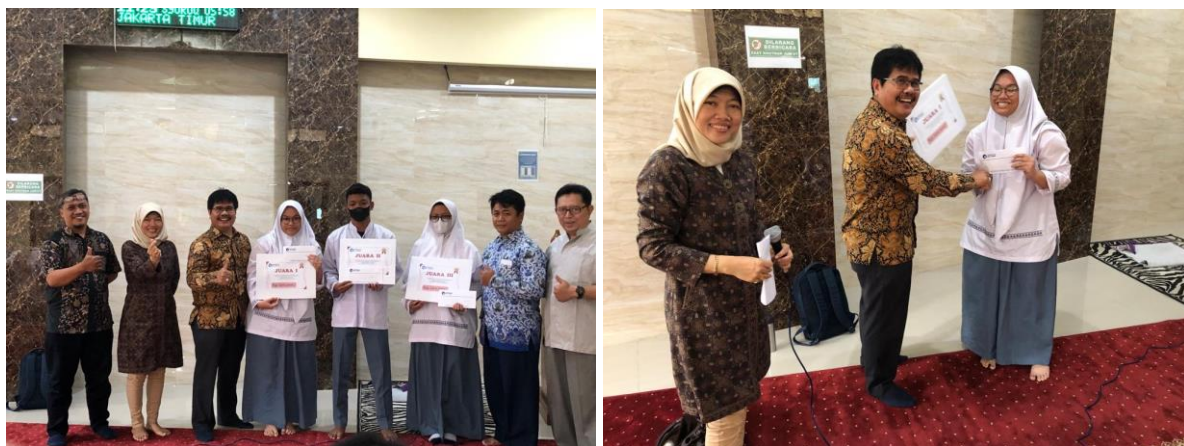
Gambar 5. Pemberian Hadiah