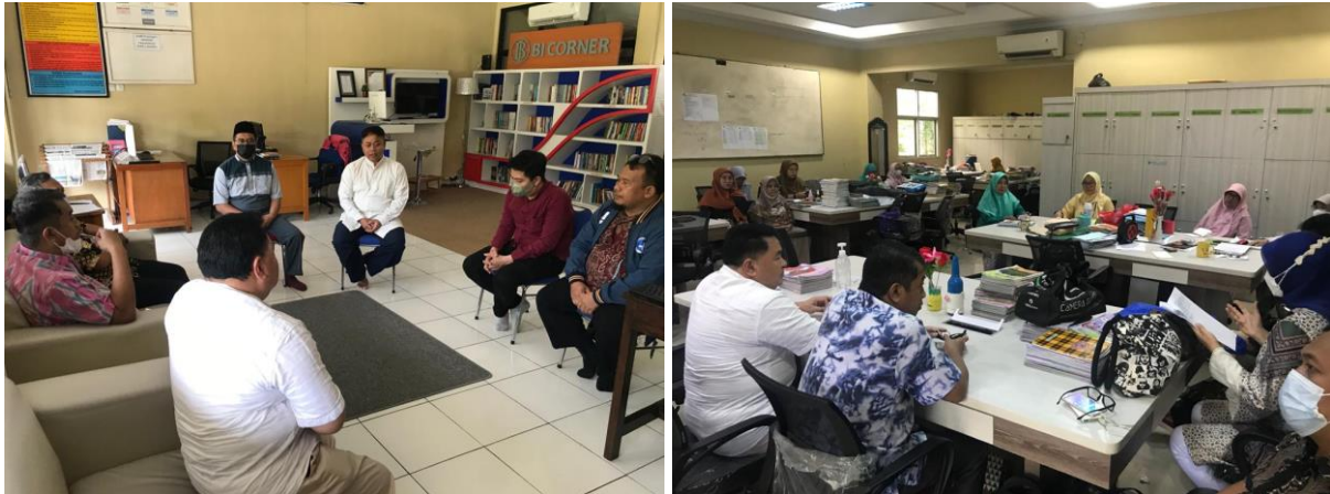
Gambar 3. Tahap Pejajakan/Permohonan

Pelaksanaan kegiatan diawali dengan kegiatan penjajakan yang dilakukan sebanyak 2 kali untuk mematangkan persiapan pelatihan Multimedia.