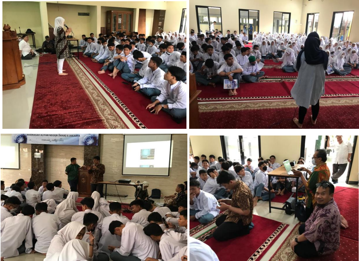
Gambar 4. Tahap Pelaksanaan Pelatihan