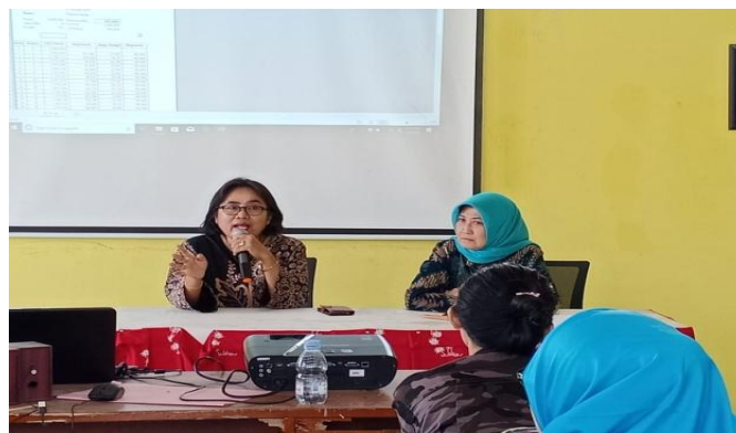
Gambar 4. Diskusi dan Berbagi Pengalaman Kepengurusan Koperasi Simpan Pinjam