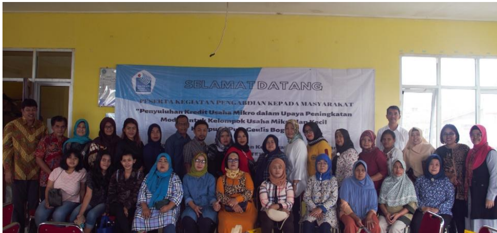
Gambar 2. Peserta dan Panitia Kegiatan Pengabdian Masyarakat

Dengan adanya penyuluhan pengajuan dan analisa kredit ini, kami bermaksud untuk membuka wawasan para peserta UMK, memberikan cara bagaimana seharusnya mengajukan kredit dan peserta menjadi “tanggap kredit” sehingga peserta termotivasi untuk mengembangkan usahanya dengan menambah modal melalui pengajuan kredit usaha.