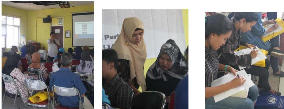
Gambar 3. Pemberian Materi oleh Narasumber dan Pendampingan Pengisian Contoh Formulir Kredit

memadai karena kami mendapatkan tempat kegiatan di Balai Kelurahan Babakan Pasar yang cukup panas dan karena keterbatasan tempat kegiatan ini hanya dapat menghadiri 25 peserta saja. Keterbatasan waktu juga yang menjadi kendala bagi peserta untuk berdiskusi lebih lanjut terutama bagi pengurus Unit Usaha Simpan Pinjam dalam menganalisis kelayakan penerimaan dan penolakan kredit.